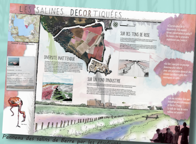
Panneau des salins de Berre par les étudiants

L'exposition, portée par l'université d'Aix-Marseille et le CFPPA de Carpentras-Serres, est réalisée avec l'appui technique du Pôle-relais lagunes méditerranéennes et les conseils des gestionnaires des sites.