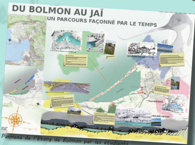
Panneau de l'Etang de Bolmon par les étudiants

Le paysage constitue un système visible; les éléments matériels s'agencent dans l'espace où ils composent un spectacle donné à voir à travers les formes visuelles».*